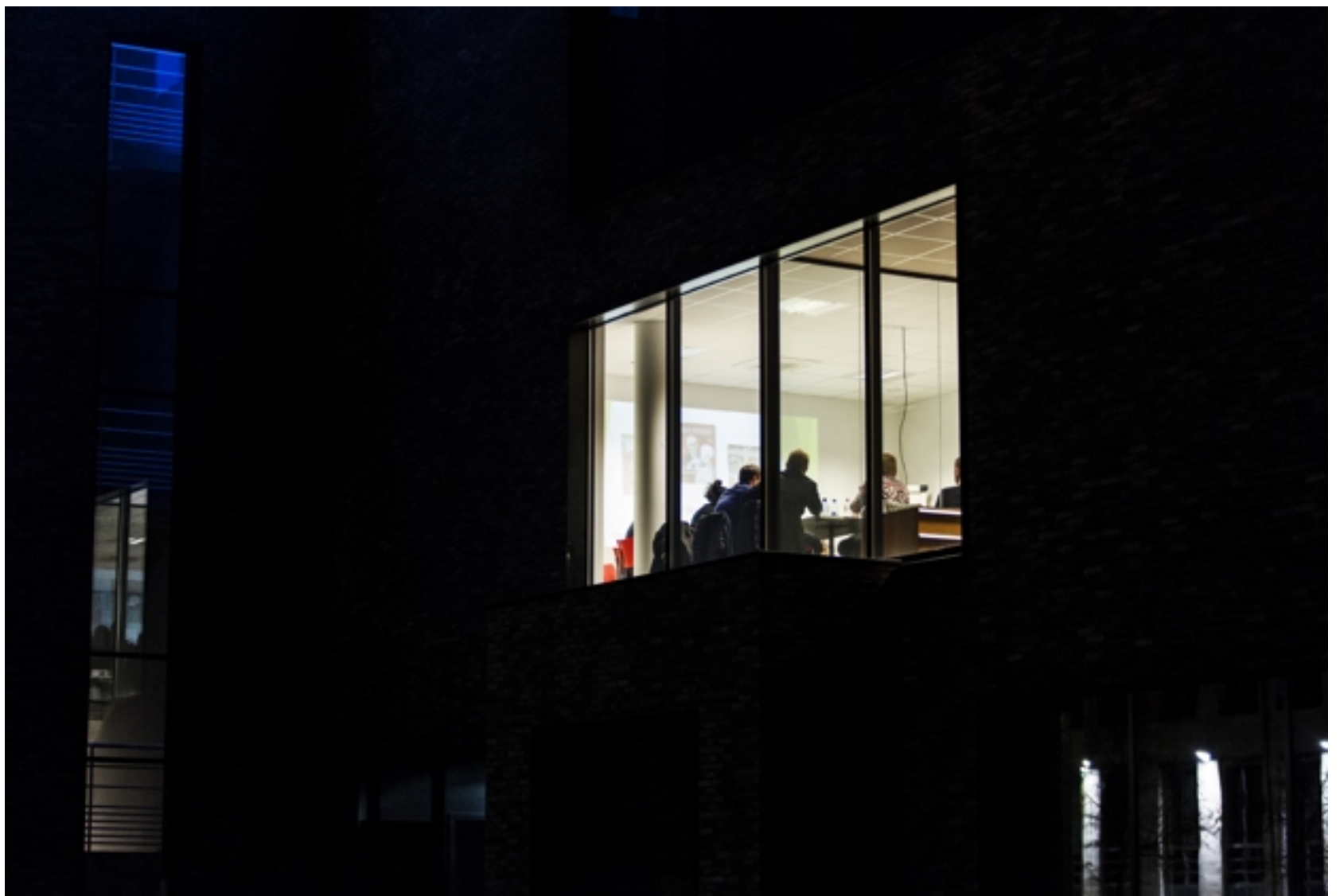
Op de jongste vergadering was de Moneymakers alweer geen rust gegund.

Maar de wens om te profiteren van de immer sterk schommelende