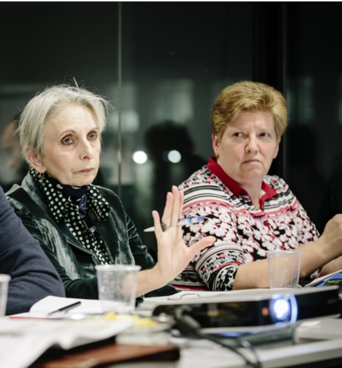
integraal op te nemen in de strategie.