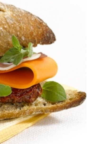
Nieuw in het sterk presterende Gimv-fonds: de kaas van Comtoise.