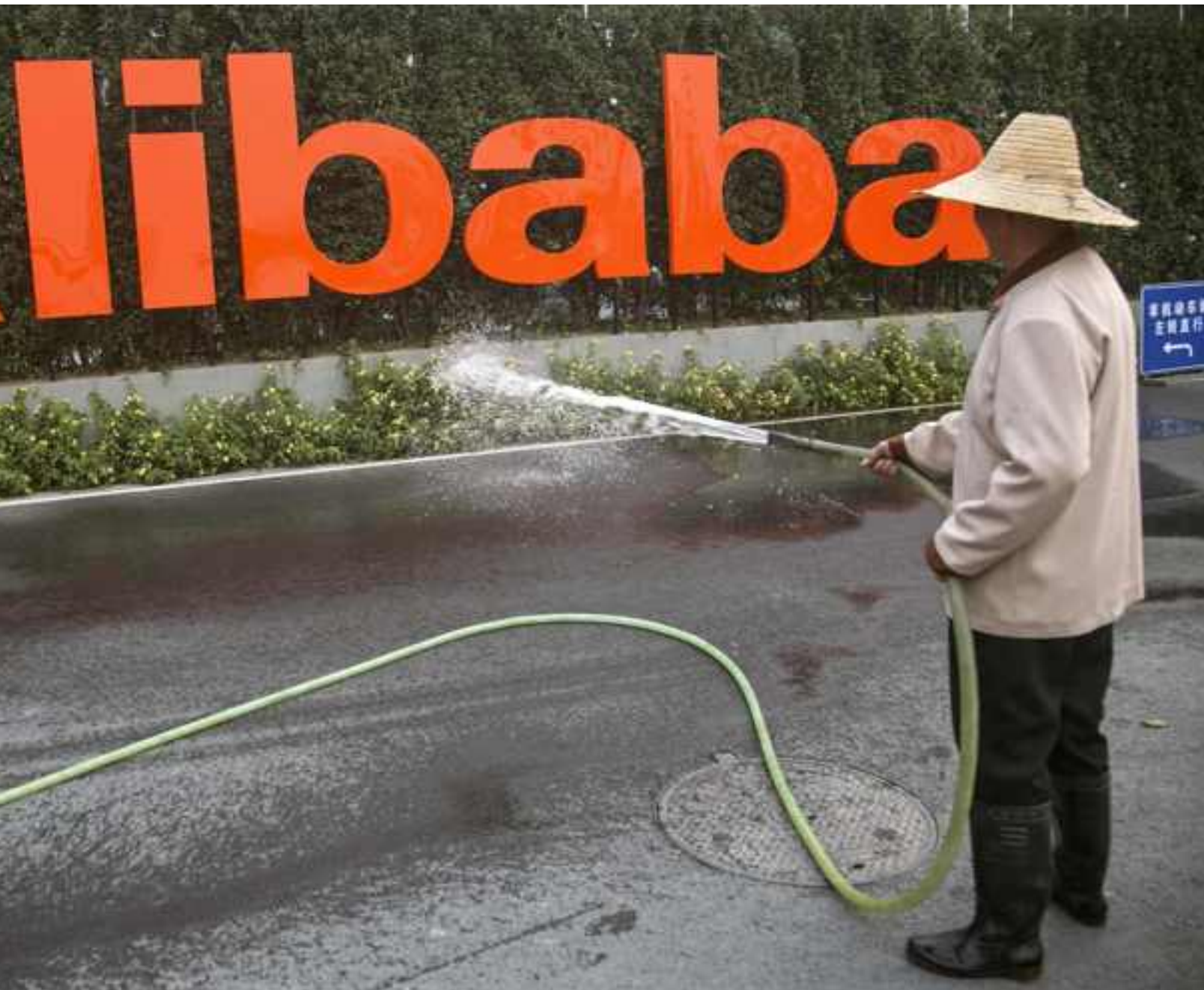
Alibaba werd net voor de correctie gekocht, maar is een solide groeier die grote winsten maakt.

aandeel ging diep in het rood ( zie tabel ).