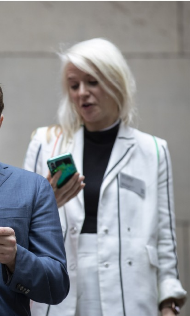
Gedacht heeft het aandeel deze week uit zijn portefeuille gegooid.

Op de beurs werd Ahold gisteren beloofd voor zijn kwartaalrapport, met een koersstijging van 5 procent. Ter vergelijking: dat is ongeveer de jaarwinst voor het aandeel van Carrefour.