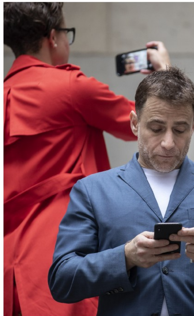
Stewart Butterfield, de ceo van Slack, bij de beursgang in juni van dit jaar. Nooit