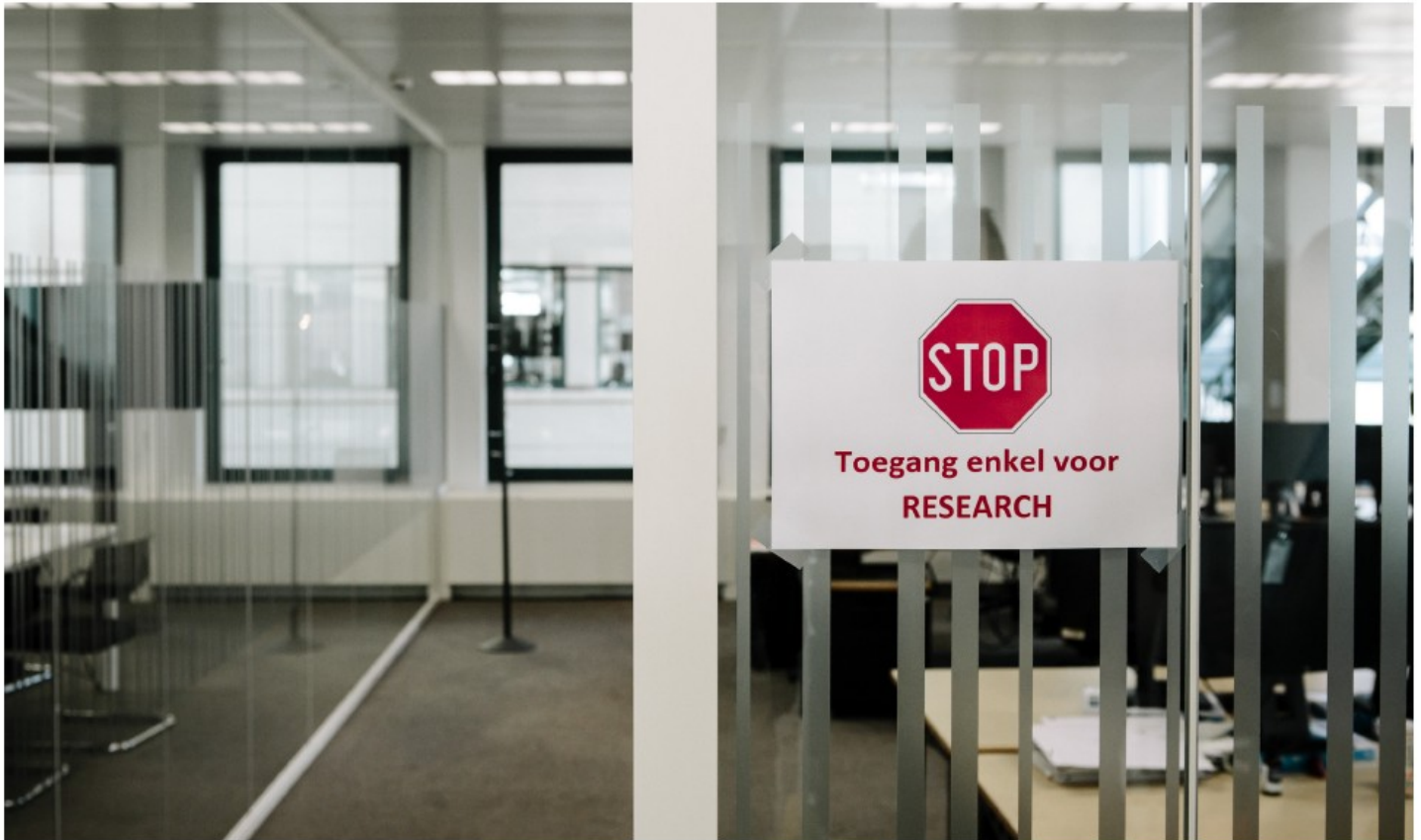
De analisten van KBC Securities zitten in een afgesloten kantoor om belangenconflicten te vermijden.

Twintig lezers van De Standaard gaan de uitdaging aan om de beurs te verslaan. Samen zijn ze, verdeeld over twee groepen, lid van De Beleggingsclub.