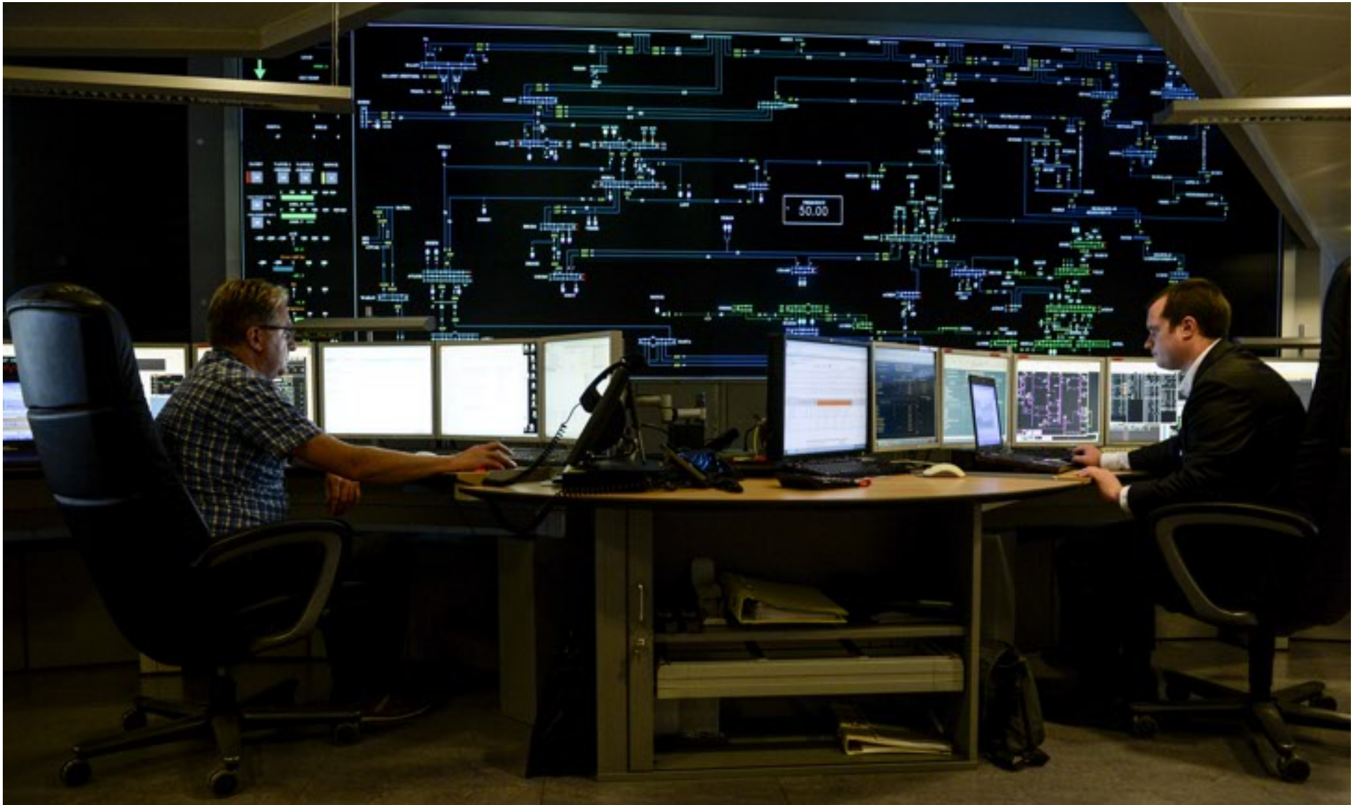
Het controlecentrum van Elia. Onze beursclub plaatste orders om aandelen te kopen zodra ze onder een bepaalde prijs gingen, maar de koers ging net hoger.