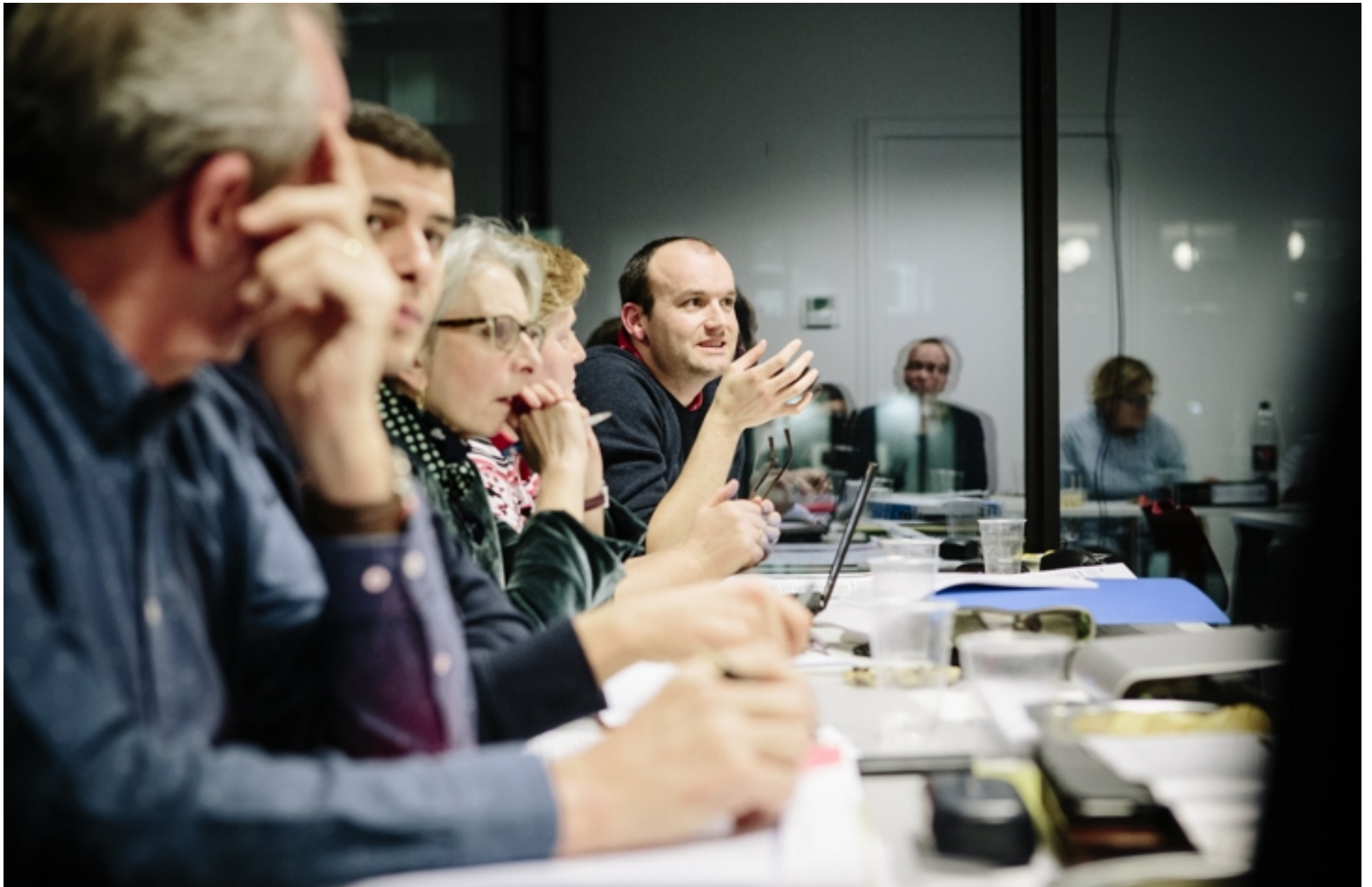
In de Money Making Monday Club zit behoorlijk wat beleggingservaring .

TEKST: JAN REYNS