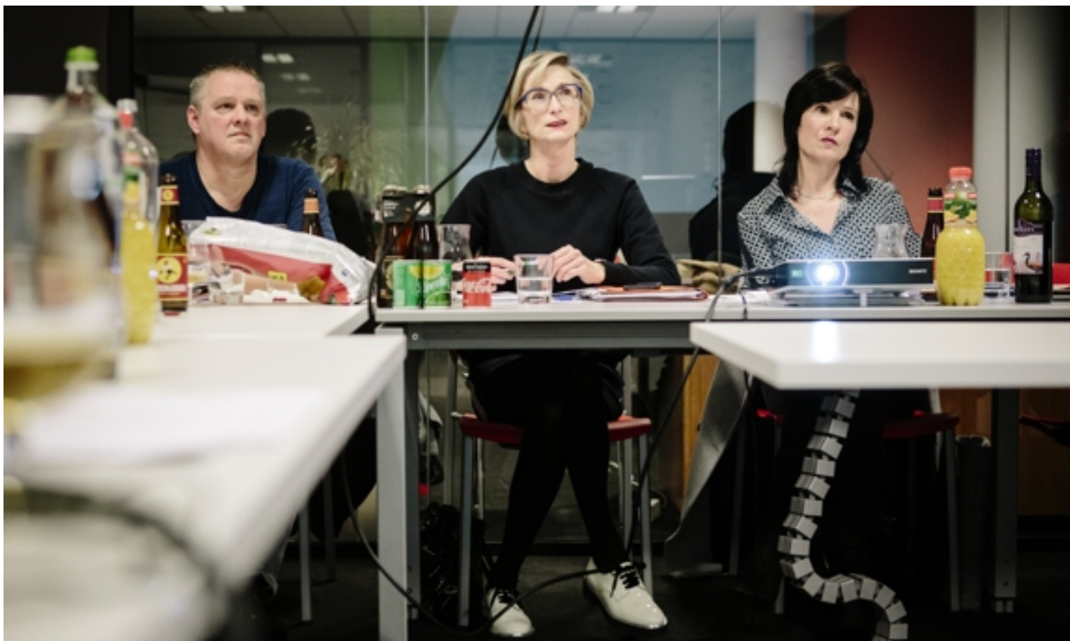
Bij de holdings kozen de leden van 'Nooit Gedacht' voor Brederode en Gimv.

ges nooit bos kapt en dat palmolie onmisbaar is.