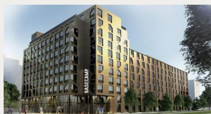
Malmö - Zweden