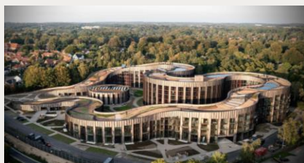
Lyngby - Denemarken