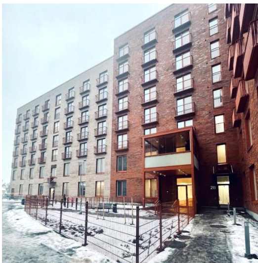
Turku Herttuankulma – Turku (FI)

In het vierde kwartaal van 2022 werden achttien ontwikkelingsprojecten, één renovatieproject en één uitbreidingsproject uit Aedifica's investeringsprogramma opgeleverd in Nederland, Duitsland, het Verenigd Koninkrijk en Finland voor een totaalbedrag van 197 miljoen €. Deze zorglocaties, die aan Aedifica's portefeuille bijkomende capaciteit toevoegen voor 1.094 residenten en 345 kinderen, worden uitgebaat door een gediversifieerde pool van gevestigde en ervaren private (zowel for-profit als non-profit) en publieke exploitanten (met name Finse gemeenten). De negen projecten in Finland zijn ontworpen en ontwikkeld door ons lokale Hoivatilat-team.