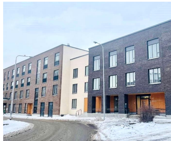
Helsinki Malminkartano – Helsinki (FI)