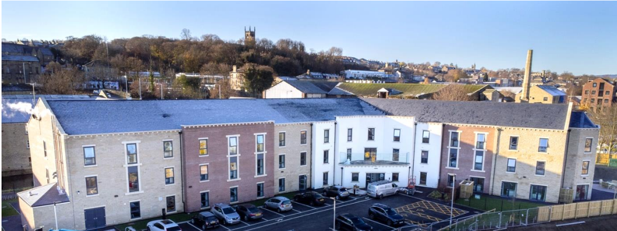
Shipleigh Canal Works – Shipleigh (UK)

10 januari 2023 – na sluiting van de markten Onder embargo tot 17u40 CET