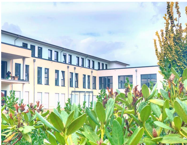
Seniorenquartier Twistringens – Twistringens (DE)