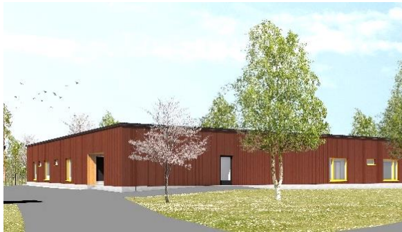
Oulu Pateniemenranta– Oulu (FI)

29 juni 2022 – na sluiting van de markten Onder embargo tot 17u40 CET