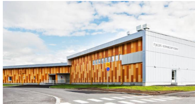
Oulu Riistakuja – Oulu (FI)