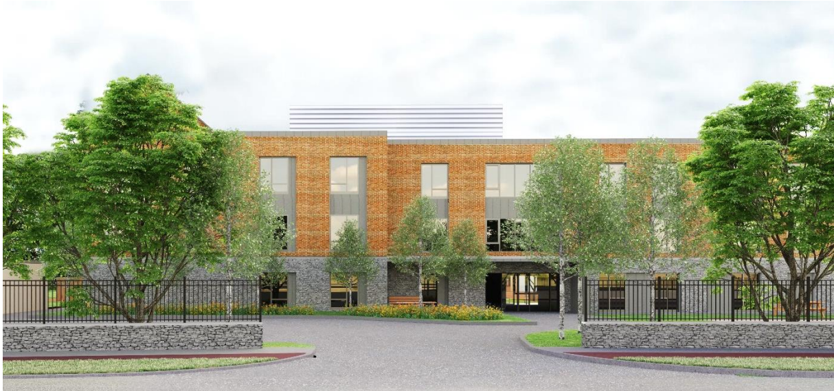
Dunshaughlin Business Park (illustratie) – Dunshaughlin

Aedifica zal ca. 18,5 miljoen € investeren in de bouw van een woonzorgcentrum in Dunshaughlin (Ierland).