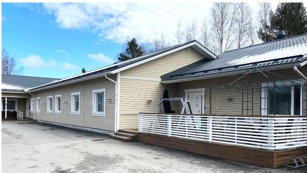
Kärrytie 1 – Kokkola

Aedifica investeert ca. 12,5 miljoen € in de acquisitie van een portefeuille van 3 zorgvastgoedsites in Kokkola (Finland).