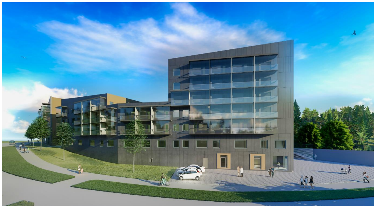
Kangasala Vällintie (impressie) – Kangasala

Kangasala Vällintie zal gebouwd worden in een residentiële wijk in Kangasala (32.000 inwoners). Het kinderdagverblijf is speciaal ontworpen om aan maximaal 87 kinderen onderwijs voor jonge kinderen te bieden. Het wordt ontworpen door Hoivatilat en bevindt zich op de gelijkvloers van een groter residentieel project dat door een derde partij wordt ontwikkeld. De bouwwerkzaamheden gaan in de zomer van 2021 van start en zullen naar verwachting in het vierde kwartaal van 2022 opgeleverd worden.