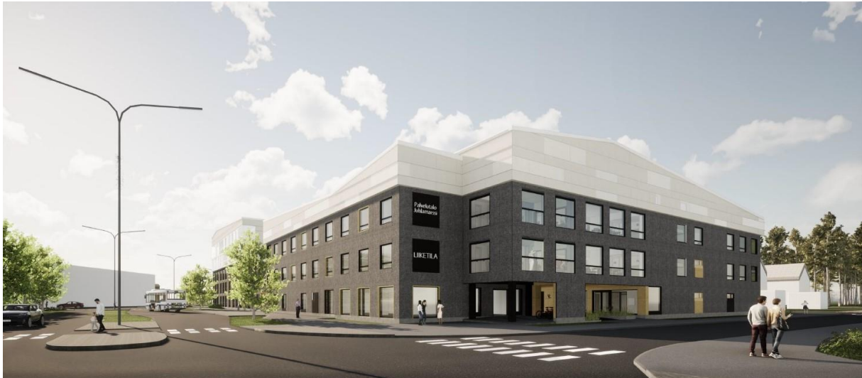
Oulu Juhlarssi (impressie) – Oulu

Oulu Juhlarssi zal gebouwd worden in een residentiële wijk in Oulu (209.000 inwoners). Het woonzorgcentrum is specifiek afgestemd op de noden van ouderen met hoge zorgbehoeften en zal een nieuwe thuis bieden aan 58 bewoners. Het is ontworpen en ontwikkeld door Hoivatilat. De bouwwerkzaamheden zijn recent van start gegaan en zullen naar verwachting in het derde kwartaal van 2022 worden opgeleverd.