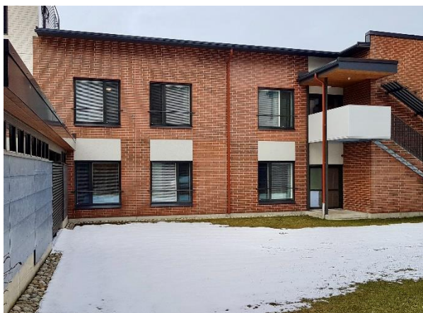
Ilkantie 1 – Kokkola

28 juni 2021 – na sluiting van de markten Onder embargo tot 17u40 CET