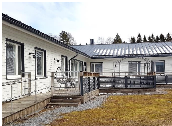
Metsämäentie 62 – Kokkola