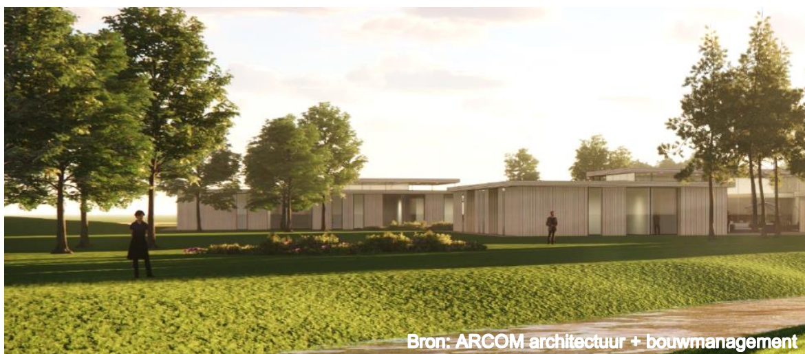
De Volder Staete Almere (impressie) – Almere

6 juli 2021 – na sluiting van de markten Onder embargo tot 17u40 CET