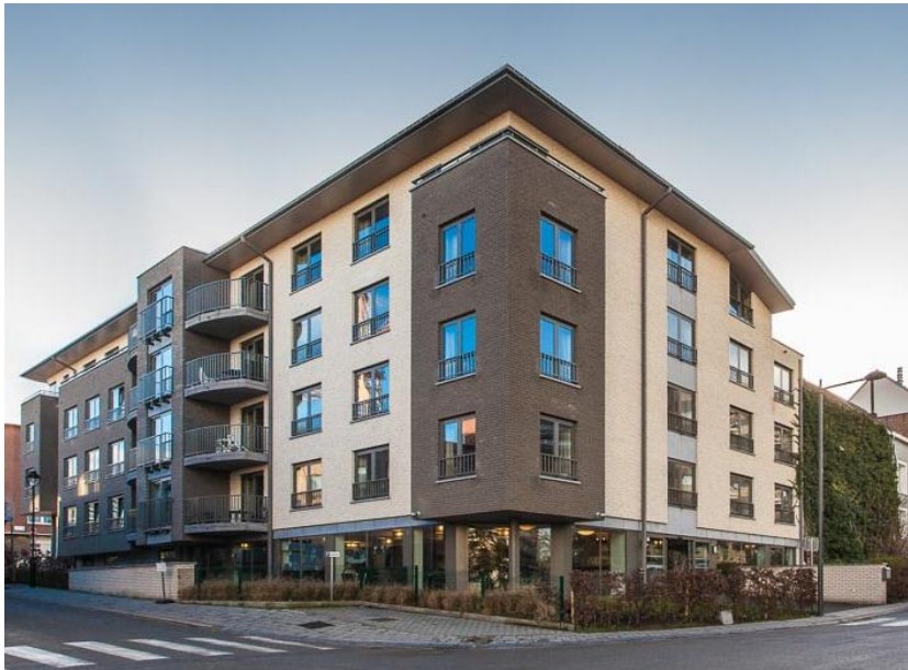
Residentie van de Vrede 4 – Evere

8 oktober 2018 – na sluiting van de markten Onder embargo tot 17u40