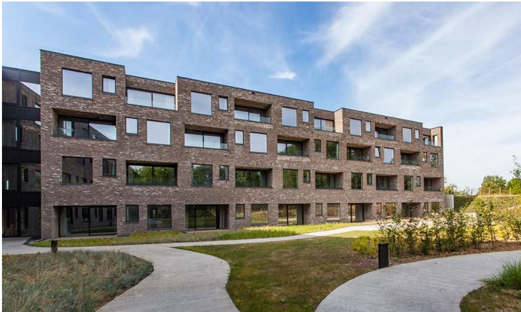
Residentie Kartuizerhof 1 – Lierde

Aedifica heeft twee woonzorgcentra in België verworven.