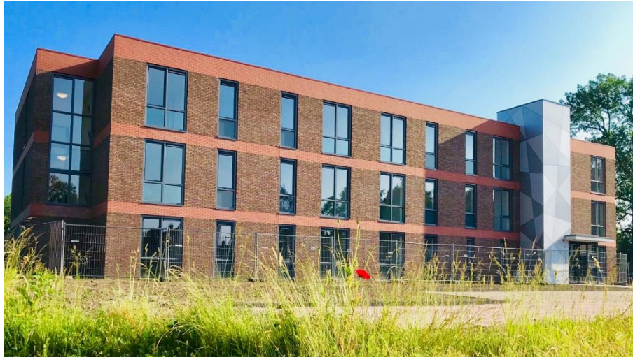
Meldestraat – Noordoostpolder

Aedifica heeft een nieuwe zorgvastgoedsite in Noordoostpolder verworven.