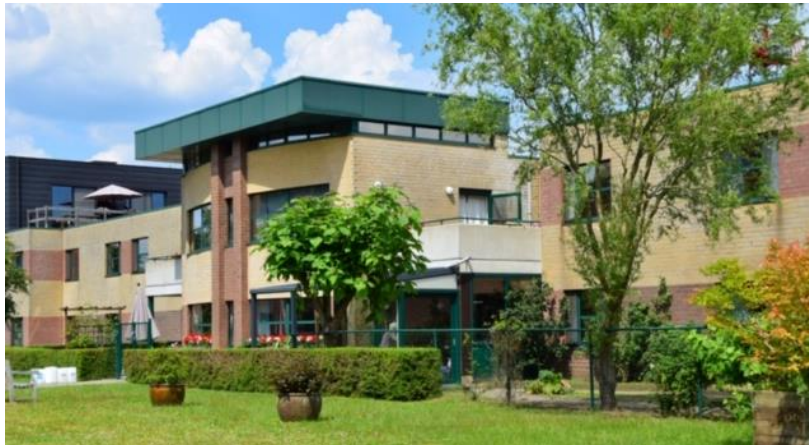
Bremdael – Herentals

Aedifica heeft een woonzorgcentrum in Herentals verworven. Deze acquisitie werd deels gefinancierd door een inbreng in natura. In dat kader werden 12.590 nieuwe aandelen uitgegeven.