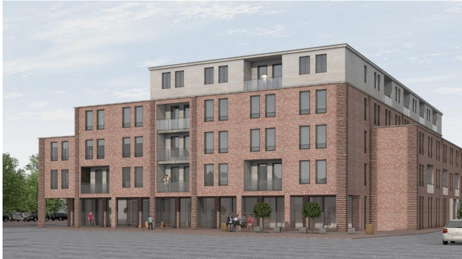
Quartier am Rathausmarkt (tekening) – Bremervörde

Aedifica heeft een overeenkomst gesloten voor de acquisitie van twee rustoorden in exploitatie en een te bouwen zorgvastgoedsite in Duitsland.