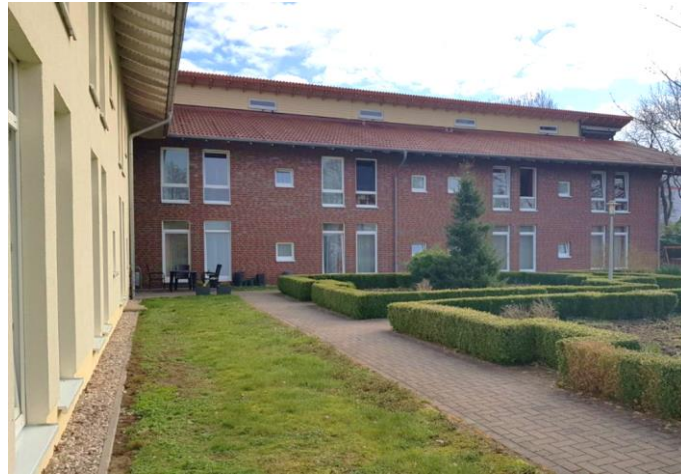
Sonnenhaus Ramsloh – Ramsloh

12 november 2019 – na sluiting van de markten Onder embargo tot 17u40 CET