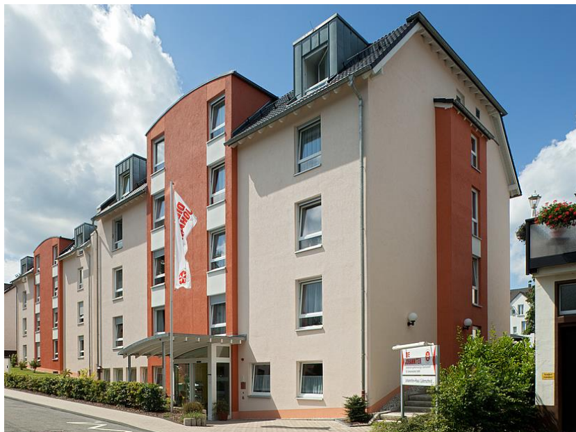
Johanniter-Haus Lüdenscheid – Lüdenscheid

12 november 2019 – na sluiting van de markten Onder embargo tot 17u40 CET